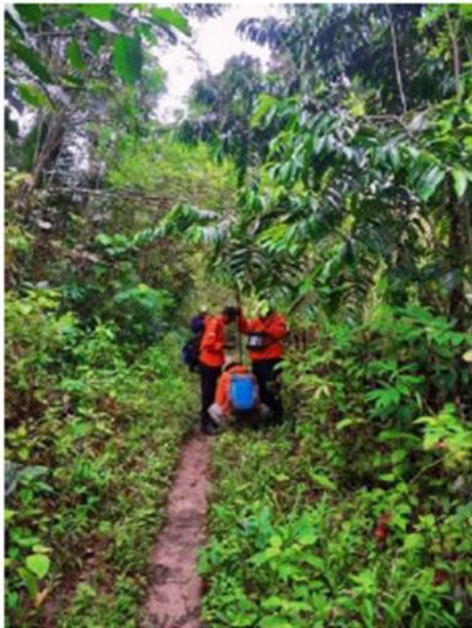
Gambar 4. Akuisisi data geomagnet pada salah satu lokasi pengukuran

Kemudian dilakukan akuisisi data menggunakan metode geomagnet di lokasi tersebut sebagai data pendukung interpretasi bawah permukaannya (Gambar 4). Setelah akuisisi data magnetik dan studi geologi selesai dilanjutkan dengan interpretasi, yang mana bertujuan untuk menambah wawasan dan pengetahuan terkait aplikasi keilmuan geofisika khususnya pengimplimentasiannya di lapangan langsung, yakni di area Tulehu.