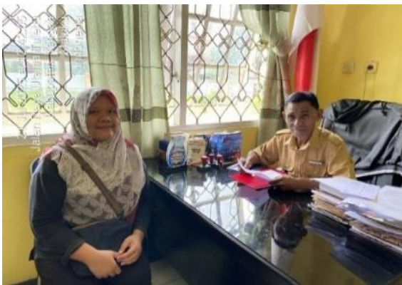
Gambar 1. Koordinasi dengan pemerintah setempat.

Kegiatan diawali dengan penyusunan rundown acara yang dilakukan di awal sebelum kegiatan untuk mempermudah koordinasi di lokasi. Koordinasi lebih lanjut dengan pemerintah daerah Tulehu juga dilakukan supaya kegiatan lebih terarah (Gambar 1).