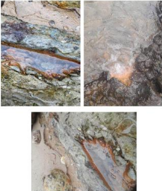
Gambar 6. Manifestasi sumber air panas yang terdapat di area Tulehu

geomagnet yang dalam hal ini dilakukan dan dikaji langsung oleh tim PkM dan seluruh mahasiswa. Sehingga diharapkan kedepannya kegiatan PkM dapat membantu mengembangkan potensi sumber daya mineral yang terdapat di wilayah tersebut dengan strategi-strategi lainnya di masa depan (Sitaniapessy & Rumalatu, 2024).