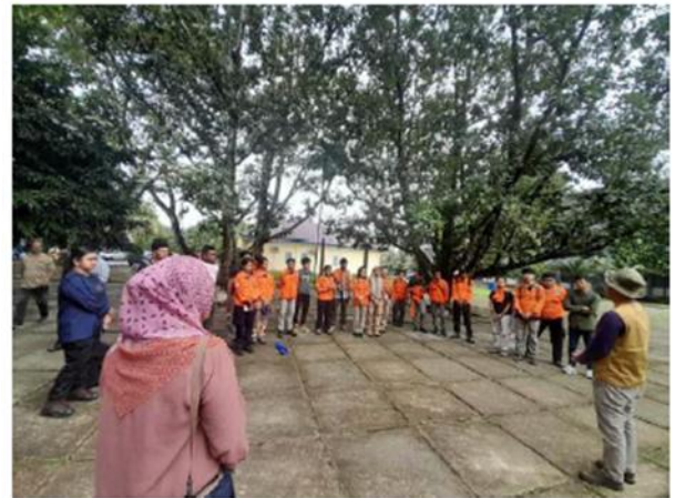
Gambar 2. Pengarahan sebelum kegiatan PkM

Dalam hal ini diberikan penjelasan dan arahan terkait implementasi kuliah lapangan geofisika ini terhadap peserta kegiatan yakni tim PkM dan mahasiswa secara edukatif (Yarmaliza et al., 2025) (Gambar 2).