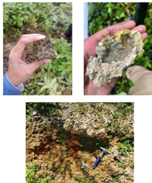
Gambar 3. Outcrop sampel batuan disekitar area

Selanjutnya dilakukan akuisisi data yakni berupa pengambilan sampel batuan dari hasil pengamatan bentang geologi pada beberapa lokasi yang teridentifikasi manifestasi sumber panas bumi atau hot spring (Gambar 3).