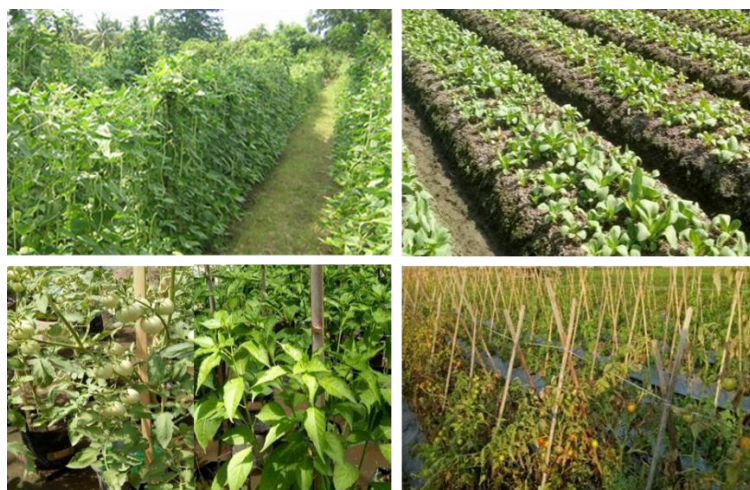
Gambar 4. Pertumbuhan kacang panjang, sawi-pakcoy, tomat dan cabe rawit yang lebih subur pada aktivitas pendampingan langsung di lapang (Gbr. Atas dan kiri bawah), dibandingkan dengan