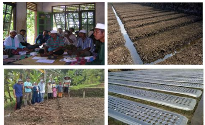
Gambar 1 Aktivitas kegiatan pelatihan (Gbr. kiri atas); Pembentukan guludan lebar 1,5 m tinggi 35 cm (Gbr. kanan atas); Aktivitas pendampingan langsung di lahan sawah (Gbr. kiri bawah); dan aplikasi mulsa plastik untuk penanaman sawi-pakcoy (Gbr. kanan bawah).

Kegiatan pendampingan dilakukan dengan agihan waktu yang lebih lama, yaitu mulai tanggal 15 Oktober 2026 sampai dengan 30 Desember 2026. Seluruh rangkaian kegiatan pendampingan dimulai dari penerapan teknologi tepat guna (TTG) dan evaluasi. Implementasikan TTG pada kegiatan pendampingan meliputi pengolahan tanah, pembuatan guludan-guludan dan petak-petak penanaman, pengadaan bahan tanam dari varietas unggul, penanaman dengan sistem siklus dan seri, pemeliharaan tanaman, panen, penanganan pascapanen dan pemasaran. Aktivitas kegiatan pelatihan dan pendampingan secara langsung di lapang disajikan pada Gambar 1.