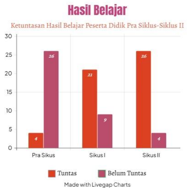
Gambar 2. Ketuntasan Hasil Belajar Peserta Didik Pra Siklus-Siklus II

Diagram 1 menunjukkan jumlah nilai rata-rata peserta didik pada pembelajaran Bahasa Indonesia dalam Bab II Aku yang Unik . Pada kegiatan pra siklus,