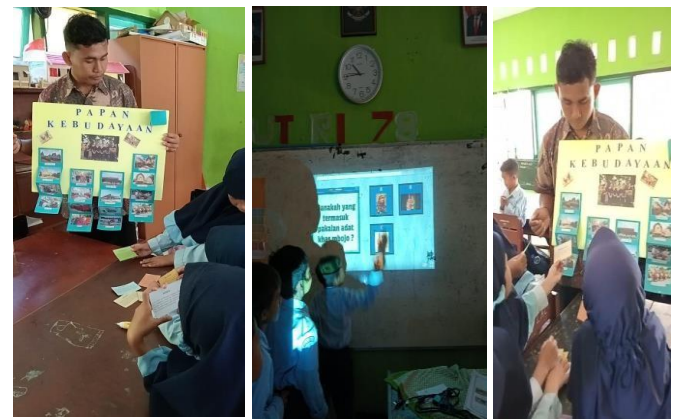
Gambar 3. Penerapan Media Papan Kebudayaan yang diintegrasikan dengan media Wordwall

Jumlah peserta didik yang telah tuntas dalam pelajaran bahasa Indonesia yaitu berjumlah 15 orang dan 0 orang jumlah yang tidak tuntas. Sehingga dalam persentase menunjukkan 100 % mencapai ketuntasan dan 0 % persentase ketidaktuntasan. Jadi, hasil belajar Bahasa Indonesia dengan penggunaan media papan kebudayaan sasambo melalui pendekatan CRT menunjukkan peningkatan yang signifikan. Pada diagram tersebut menunjukkan perbandingan hasil belajar pada siklus 1 dan siklus II terjadi peningkatan yang signifikan dalam persentase ketuntasan peserta didik pada proses pembelajaran Bahasa Indonesia dengan penggunaan media papan kebudayaan sasambo melalui pendekatan CRT.