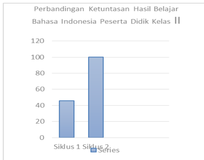
Gambar 2. Diagram 1. Hasil Belajar Siklus 1 dan Siklus II

Hasil belajar pada siklus II menunjukkan bahwa nilai rata-rata peserta didik telah meningkat yaitu dari 69,3 pada siklus I menjadi 89 pada siklus II