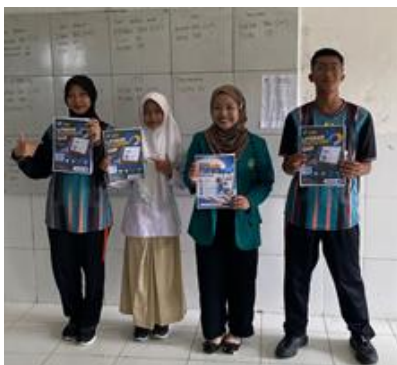
Gambar 4. Dokumentasi Pembelajaran

Variasi itu sekaligus memperlihatkan bahwa setiap siswa memiliki jalur berpikir yang berbeda dalam memahami dan mengolah informasi statistik, mulai dari membaca data, menafsirkan pola, hingga menarik dan menyampaikan kesimpulan, sehingga hasil tes ini berfungsi memperkuat gambaran kemampuan literasi statistik pada masing-masing subjek penelitian.