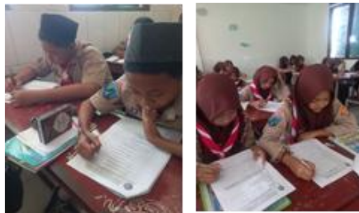
Gambar 2. Pengisian Angket Kecerdasan Majemuk

pada kecerdasan visual spasial dengan kategori sangat tinggi, sedangkan S3 memperoleh skor 54 pada kecerdasan interpersonal dengan kategori sangat tinggi. Ketiga subjek tersebut dipilih karena mewakili variasi kecerdasan yang berbeda, sehingga diharapkan dapat memberikan gambaran yang lebih mendalam dalam analisis literasi statistik.