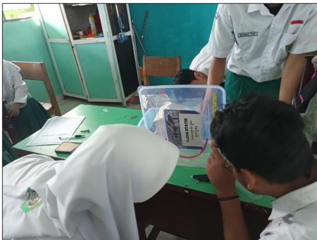
Gambar 2. Peserta Didik Melakukan Praktikum Langsung Menggunakan Media Rumah Lanting

Capaian tinggi pada indikator kedua juga tidak terlepas dari peran LKPD yang tinggi validitasnya (93,75%). Panduan kegiatan dalam LKPD tersebut membantu peserta didik menjalani setiap tahap penyelidikan secara runtut, sekaligus menjadi jembatan antara pengalaman empiris dan pemahaman konseptual. Hal ini selaras dengan Wisnuputri et al. (2023) yang menyatakan LKPD berbasis inquiry efektif memfasilitasi peralihan dari pengalaman konkret ke pemahaman yang lebih mendalam. Sementara itu, Eymur & Cetin (2024) menegaskan bahwa keterlibatan aktif dalam kegiatan praktikum berbasis inquiry secara nyata melatih peserta didik dalam merancang dan mengevaluasi prosedur ilmiah.