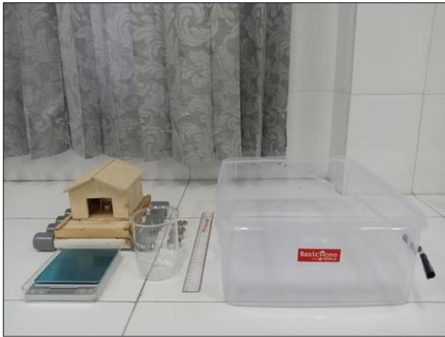
Gambar 1. Media Rumah Lanting

Gambar 1. Proporsionalitas desain dan kemiripannya dengan bangunan rumah lanting yang sesungguhnya di kawasan Sungai Kahayan menjadi faktor kunci yang menguatkan validitas media dari aspek visual maupun representasi kultural.