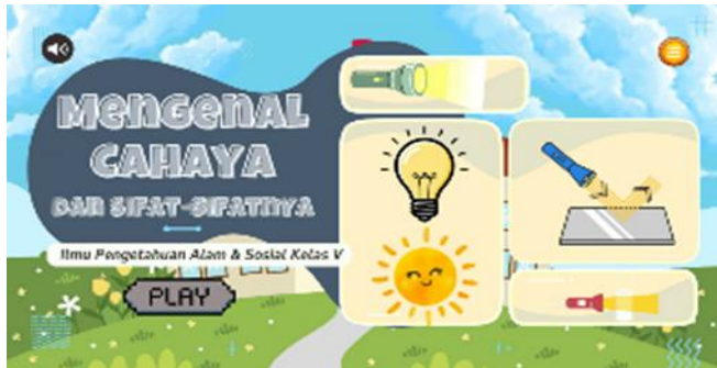
Gambar 1. Cover Media Science App

penyempurnaan tampilan dan fungsi agar media dapat berjalan dengan baik. Hasil dari tahap ini adalah produk awal Science App yang siap untuk dilakukan uji validasi oleh ahli materi, ahli media, dan ahli desain sebelum digunakan dalam uji coba pembelajaran.