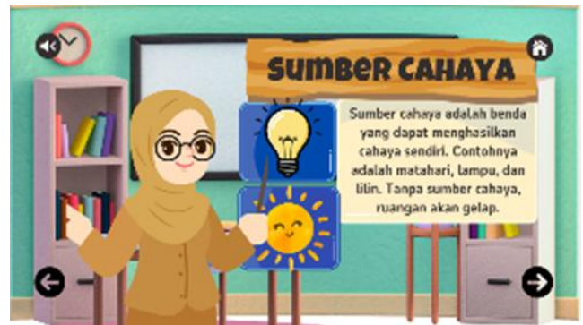
Gambar 5. Materi Pembelajaran