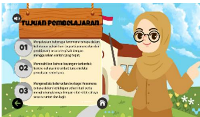
Gambar 4. Tampilan CP, TP dan ATP