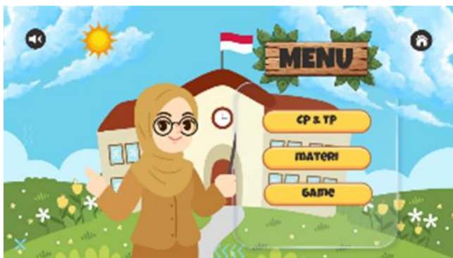
Gambar 2. Tampilan Menu