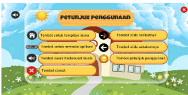
Gambar 3. Tampilan Petunjuk Penggunaan