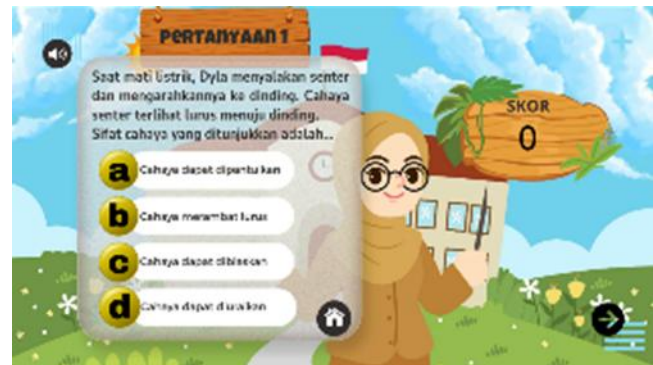
Gambar 6. Kuis Soal Cerita

Berdasarkan Gambar 1 dan Gambar 2, ditampilkan cover serta tampilan menu awal dari media Science App yang dirancang untuk menarik perhatian siswa sebelum memasuki materi pembelajaran. Pada Gambar 3 ditunjukkan petunjuk penggunaan media yang berfungsi sebagai petunjuk dan memudahkan pengguna dalam mengakses setiap fitur yang tersedia di dalam media.