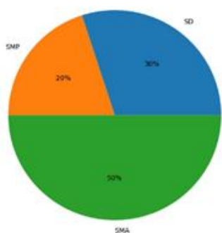
Gambar 3. Diagram Jenjang Pendidikan

Meskipun terdapat perbedaan karakteristik peserta didik pada setiap jenjang pendidikan, berbagai penelitian yang dilakukan pada jenjang SD hingga SMP membuktikan bahwa model pembelajaran inkuiri mengembangkan keterampilan berpikir kritis siswa apabila penerapannya disesuaikan dengan tahap perkembangan kognitif mereka serta didukung oleh bimbingan guru yang memadai. Pada jenjang tersebut, kegiatan inkuiri umumnya dilaksanakan melalui aktivitas sederhana, seperti observasi langsung, diskusi kelompok, dan eksperimen dasar. Aktivitas-aktivitas tersebut terbukti mampu mengembangkan kemampuan berpikir logis, analitis, dan kritis siswa. Hasil studi juga mengindikasikan bahwa model pembelajaran inkuiri memiliki tingkat adaptabilitas yang tinggi sehingga dapat diterapkan pada berbagai jenjang pendidikan karena mampu mendorong keterlibatan aktif siswa, menumbuhkan kemandirian dalam membangun pengetahuan, serta meningkatkan kesiapan mereka dalam menghadapi berbagai permasalahan.