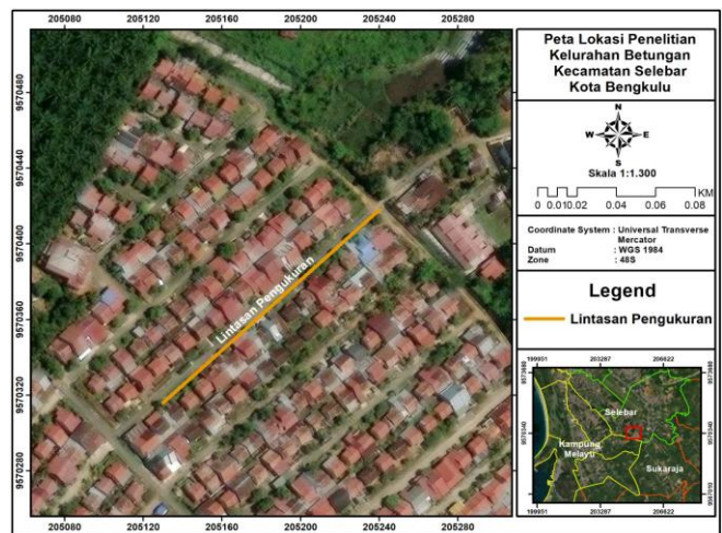
Gambar 2. Peta Lokasi Penelitian

Akuisisi data dilakukan menggunakan metode geolistrik resistivitas dua dimensi (2D) dengan konfigurasi Wenner. Peralatan yang digunakan meliputi resistivity meter, elektroda, kabel penghubung, aki sebagai sumber daya listrik, meteran, palu, GPS, dan laptop. Pengukuran dilakukan sepanjang lintasan penelitian dengan jarak antar elektroda yang disesuaikan untuk memperoleh informasi variasi resistivitas bawah permukaan. Data hasil pengukuran kemudian diolah menggunakan perangkat lunak Res2DINV melalui proses inversi sehingga diperoleh