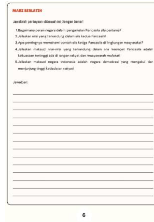
Tabel 1. Revisi ahli materi Tampilan LKPD sebelum revisi