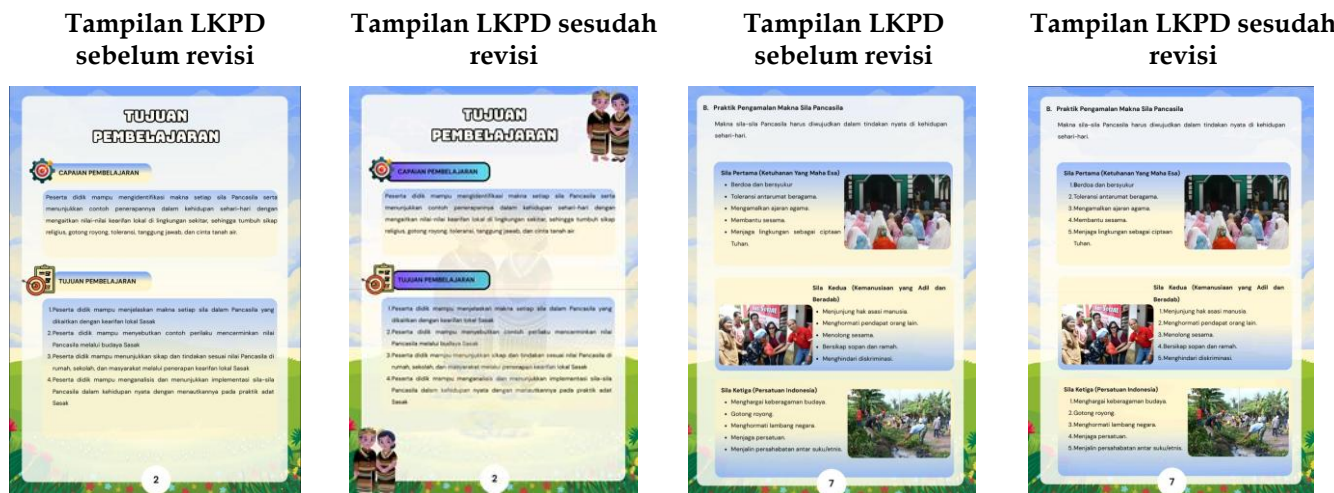
Tabel 2. Revisi ahli media

Pada gambar diatas ebelum revisi, validator memberikan masukan agar sub judul menggunakan warna yang berbeda dan sedikit lebih terang agar tampilan lebih menarik.