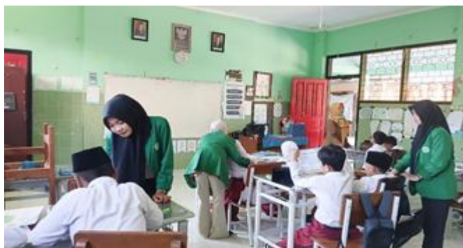
Gambar 2. Membaca Terarah

Pada tahap membaca terarah, siswa diberikan kesempatan untuk membaca teks yang telah disiapkan. Kegiatan membaca dilakukan secara mandiri dengan arahan dari guru mengenai hal-hal penting yang perlu diperhatikan, seperti isi cerita, tokoh, dan pesan yang terdapat dalam bacaan.