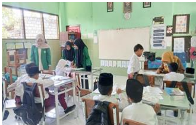
Gambar 4. Diskusi Lingkaran refleksi

Tahap selanjutnya adalah diskusi lingkaran refleksi, di mana siswa duduk membentuk lingkaran dan secara bergiliran menyampaikan pendapat mereka. Kegiatan