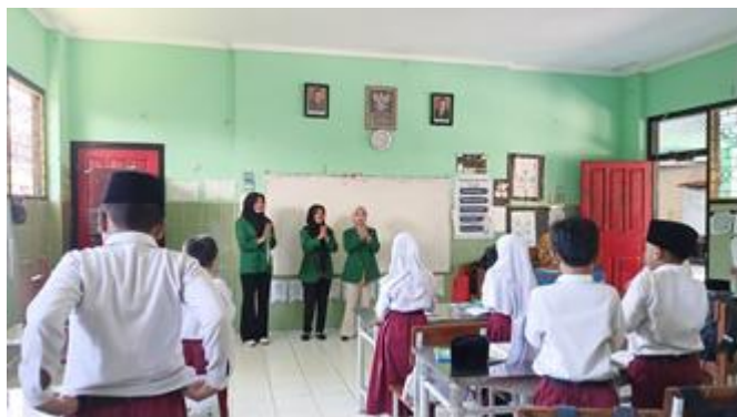
Gambar 1. Tahap persiapan

mereka. Selain itu, peneliti juga menyiapkan jurnal reflektif sederhana yang digunakan siswa untuk menuliskan hasil pemahaman dan pendapat mereka. Jurnal ini dirancang dengan format yang mudah dipahami agar siswa tidak merasa kesulitan dalam menuangkan ide. Melalui jurnal ini, siswa dilatih untuk mulai berpikir secara kritis dan sistematis. Pengaturan tempat duduk juga menjadi bagian penting dalam tahap persiapan. Siswa diarahkan untuk duduk membentuk lingkaran agar tercipta suasana belajar yang lebih terbuka, interaktif, dan tidak kaku seperti pembelajaran pada umumnya. Dengan posisi ini, siswa dapat saling melihat dan mendengarkan pendapat teman secara langsung.