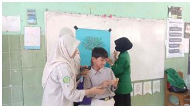
Gambar 5. Tahap Implementasi

Selain itu, suasana belajar di kelas menjadi lebih hidup dan menyenangkan. Siswa tidak hanya berperan sebagai pembaca, tetapi juga sebagai penulis dan pembicara yang aktif. Kegiatan ini memberikan pengalaman belajar yang lebih bermakna dibandingkan pembelajaran yang hanya berfokus pada membaca saja.