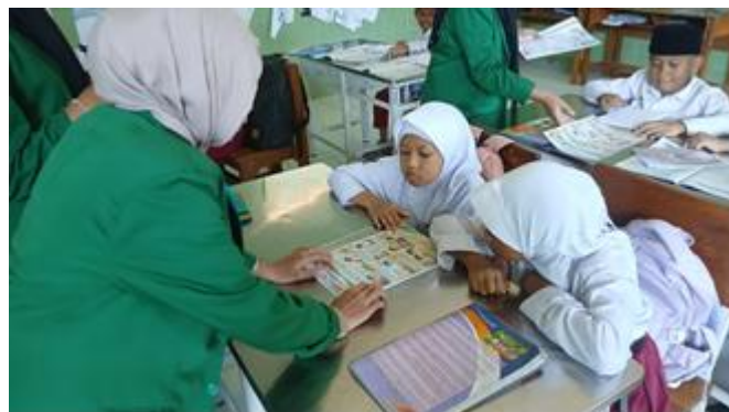
Gambar 3. Menulis Jurnal Reflektif

Setelah membaca, siswa diminta untuk menuliskan pemahaman dan pendapat mereka ke dalam jurnal reflektif. Kegiatan ini menjadi sarana bagi siswa untuk mengungkapkan apa yang mereka pikirkan tentang bacaan yang telah dibaca. Sebagian besar siswa mulai mampu menuliskan ide mereka, meskipun masih sederhana. Namun demikian, terlihat adanya usaha siswa dalam menyampaikan pendapat secara tertulis. Salah satu siswa menyampaikan "Saya suka menulis seperti ini karena bisa cerita apa yang saya pikirkan tentang cerita tadi." Pernyataan tersebut menunjukkan bahwa siswa mulai merasa nyaman dan terbiasa dalam mengekspresikan pemikirannya melalui tulisan.