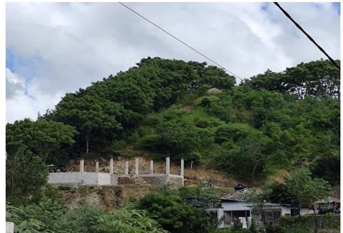
Gambar 3. Alih Fungsi Lahan

pengerukan bukit yang berujung penggundulan demi terbangunnya villa-villa megah. Berikut alih fungsi lahan dapat dilihat pada gambar 2 .