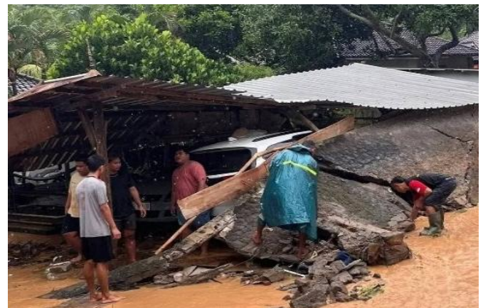
Gambar 4. Dampak Kerusakan Lingkungan

Secara Kritis, pembangunan infrastruktur pariwisata sering kali mengabaikan daya dukung lingkungan ( Carrying capacity ). Selain risiko banjir, risiko kekeringan juga dapat terjadi akibat aktivitas tersebut. Menurut Maryono (2014), berdasarkan kaidah ilmu hidrologi dan keseimbangan daerah aliran sungai (DAS), banjir dan kekeringan merupakan saudara kembar yang kedatangannya saling menyusul, dikarenakan satu penyebab. Keduanya berperilaku linier independent, artinya semua faktor yang menyebabkan banjir akan bergulir mendorong terjadinya kekeringan. Semakin dahsyat banjir yang terjadi, semakin parah pula kekeringan yang akan menyusul, begitu pula sebaliknya. Hal ini dapat dilihat pada gambar 4 .