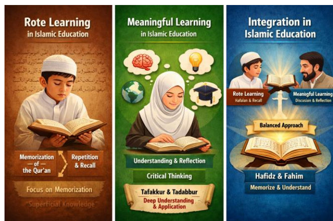
Gambar 1. Konsep Rote Learning dan Meaningful Learning

Gambar 1 merepresentasikan tiga tahapan konseptual dalam pendidikan Islam, yaitu rote learning, meaningful learning, dan integrasi keduanya sebagai pendekatan ideal. Pada bagian kiri, rote learning digambarkan sebagai proses pembelajaran berbasis hafalan, pengulangan, dan recall yang berfungsi menjaga otentisitas teks suci seperti Al-Qur'an, namun cenderung menghasilkan pengetahuan yang bersifat permukaan ( superficial knowledge ) jika tidak disertai pemahaman. Pada bagian tengah, meaningful learning menekankan proses pemahaman mendalam melalui refleksi, berpikir kritis, serta aktivitas tafakkur dan tadabbur, sehingga pengetahuan tidak hanya diingat tetapi juga dimaknai dan diaplikasikan dalam kehidupan nyata.