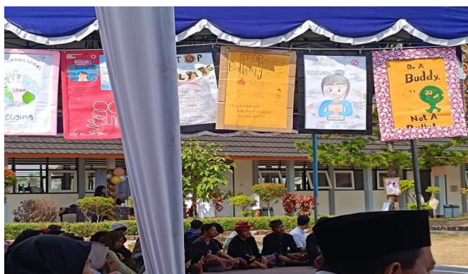
Gambar 4. Penerapan Materi P5 dalam Pembelajaran Bahasa Indonesia

Pelaksanaan pembelajaran Bahasa Indonesia di SMA Negeri 1 Praya Tengah telah terlaksana dengan baik kegiatan pembelajaran berbasis proyek sesuai dengan materi yang telah di rencanakan yaitu stop bullying . Dalam kegiatannya siswa diajak untuk membaca teks bullying , menulis puisi, membuat poster, serta menyusun dan memerankan naskah drama bertema bullying .