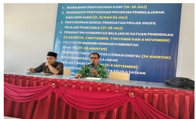
Gambar 2. Identifikasi Kesiapan Sekolah

Proses perencanaan projek P5 ditemukan data bahwa SMA Negeri 1 Praya Tengah telah melakukan identifikasi kesiapan sekolah dengan melakukan sosialisasi guru, workshop, diskusi antar guru, kolaborasi, dan penguatan literasi dengan memanfaatkan sarana dan prasarana yang telah tersedia di sekolah.