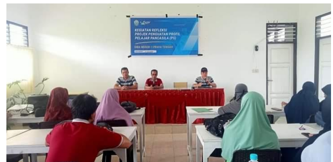
Gambar 1. Pembentukan Tim Fasilitator dan Koordinator

Mengacu pada hasil temuan di lapangan proses perencanaan kegiatan projek P5 di SMA Negeri 1 Praya Tengah hal pertama yang dilakukan yaitu membentuk tim fasilitator dan koordinator P5 untuk fasilitator diambil dari guru mata pelajaran. koordinator P5 memiliki kriteria berdasarkan kompetensi yang dimiliki, sesuai dengan bidang dan tema serta topik akan terlaksanakan dan telah mengikuti diklat. Sedangkan untuk tim koordinator terdiri dari koordinator P5 dan koordinaor masing-masing kelas. Untuk koordinator P5 merupakan wakil kepala sekolah bidang kurikulum sedangkan untuk tim koordinator masing-masing kelas dari fasilitator atau wali kelas masing-masing. Hal ini sejalan dengan pendapat Rachmadany dkk., (2024) bahwa tim koordinator yang dibentuk terdiri dari guru-guru yang telah menjalani diklat Projek Penguatan Profil Pelajar Pancasila.