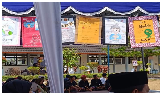
Gambar 4. Penerapan Materi P5 dalam Pembelajaran Bahasa Indonesia

Nilai pembelajaran kritis dilihat dari kemampuan siswa dalam menganalisis permasalahan bullying dan merumuskan solusi yang sesuai dengan kondisi lingkungan. Dalam kaitannya dengan hasil diatas Ananda dkk., (2023) berpendapat dalam pelaksanaan proyek P5, peserta didik terlibat aktif dalam pelaksanaannya berdasarkan pengalaman dan pengetahuan yang dimiliki siswa untuk memecahkan isu-isu atau permasalahan dengan memasukkan nilai-nilai Pancasila.