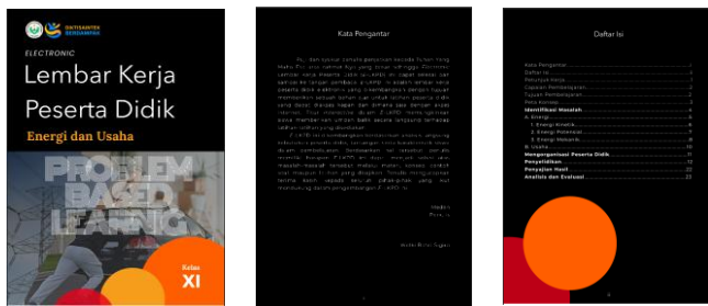
Gambar 1. Bagian awal E-LKPD

Gambar 1 adalah tampilan awal dari E-LKPD yang dikembangkan. Bagian awal E-LKPD terdiri dari sampul, kata pengantar dan daftar isi. Tampilan cover E-LKPD dirancang dengan warna hitam, kuning, orange, dan merah dengan memberikan beberapa potongan gambar sebagai ilustrasi dari materi yang disajikan dalam E-LKPD. Warna pada judul disesuaikan sehingga dapat terbaca dengan jelas.