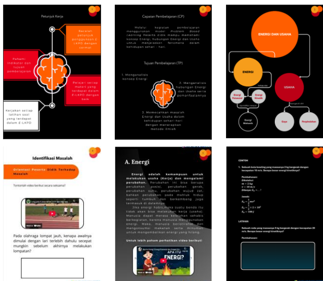
Gambar 2. Bagian Isi E-LKPD

Berdasarkan tabel 6 diperoleh rata-rata persentase penilaian validator ahli media terhadap E-LKPD yang dikembangkan yaitu 93,75% yang termasuk dalam kriteria valid.