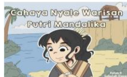
Gambar 1. Cover Media

ini adalah menghasilkan media pembelajaran yang siap diuji coba setelah melalui proses validasi dan revisi. Pengembangan dilakukan dengan menyusun konten cerita yang sederhana, edukatif, dan relevan dengan lingkungan peserta didik. Media juga diperkuat melalui penambahan ilustrasi visual yang menggambarkan unsur-unsur kearifan lokal suku Sasak, seperti: rumah adat suku sasak, pakaian tradisional sasak dan aktivitas budaya masyarakat sasak.