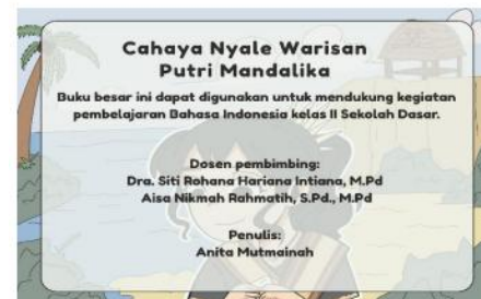
Gambar 2. Pendahuluan media