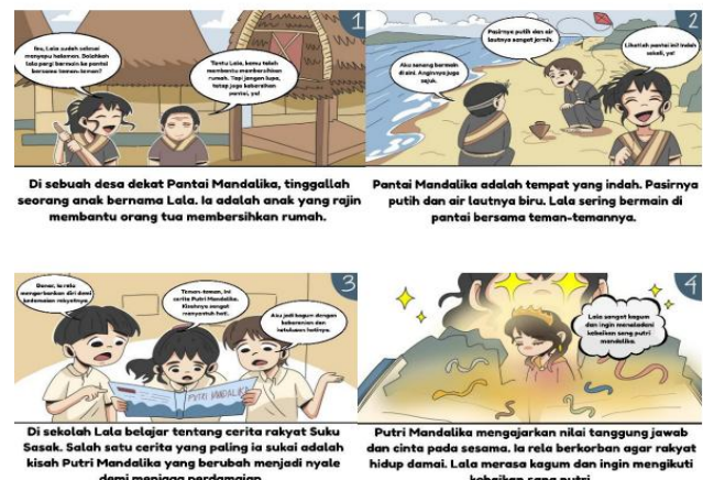
Gambar 3. Isi Media