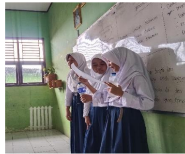
Gambar 3. Kegiatan Presentasi Setelah Diskusi Kelompok Pertemuan 1

Pada pertemuan pertama, performance assessment dilaksanakan melalui diskusi kelompok. Oral feedback diberikan pada tahap intellectually , di mana peserta didik diminta untuk berdiskusi bersama anggota kelompoknya dalam menganalisis video yang diputarkan oleh guru.