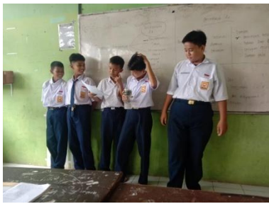
Gambar 6. Kegiatan Presentasi Setelah Diskusi Kelompok Pertemuan 4

Guru meminta peserta didik duduk di kelompoknya masing-masing sesuai pembagian sebelumnya, untuk membahas permasalahan pada video yang telah ditayangkan, sekaligus menjawab pertanyaan yang tercantum dalam LKPD. Selama proses diskusi berlangsung, guru memberikan oral feedback .