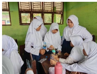
Gambar 5. Kegiatan Praktikum Filtrasi Air Pertemuan 3

Pada pertemuan ketiga, performance assessment diterapkan melalui praktikum. Oral feedback diberikan pada tahap intellectually , di mana peserta didik melaksanakan kegiatan praktikum penyaringan air.