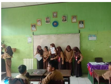
Gambar 4. Kegiatan Presentasi Setelah Diskusi Kelompok Pertemuan 2

Pada pertemuan kedua, performance assessment dilaksanakan melalui diskusi kelompok. Oral feedback diberikan pada tahap intellectually , di mana peserta didik diminta berdiskusi bersama anggota kelompoknya dalam menganalisis video yang telah diputarkan oleh guru.