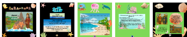
Gambar 1. Media scrapbook cerita fiksi berbasis kearifan lokal suku sasak

Define (Pendefinisian), Untuk menemukan media pembelajaran anak usia dini, para peneliti mengamati dan mewawancarai guru. Tujuannya adalah untuk menetapkan tujuan pembelajaran, mengidentifikasi karakteristik siswa, dan menemukan materi yang sesuai dengan budaya. Tahap ini penting untuk kontekstualisasi dan kesesuaian media dengan lapangan. (Wahyuningtyas, 2019). Design (Perancangan) dilakukan dengan menyusun konten media berupa cerita rakyat Legenda Putri Mandalika yang diadaptasi menjadi cerita fiksi yang sederhana dan menarik untuk anak. Dalam tahap ini, dilakukan perancangan alur cerita, naskah, ilustrasi, layout halaman, serta elemen visual interaktif seperti gambar warna-warni dan pop-up. Desain media disesuaikan dengan prinsip pengembangan media pembelajaran untuk anak usia dini, yakni menarik secara visual, komunikatif, dan sesuai perkembangan bahasa anak (Wardhani, 2018; Susliana & Wahyuni, 2019).