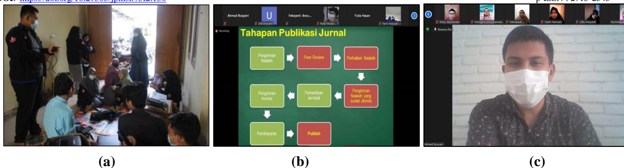
Gambar 2. Kegiatan (a) Koordinasi dengan HIMAFis, (b) Klasikal, dan (c) Non-Klasikal

Setelah kegiatan klasikal berlangsung, mahasiswa kemudian diberi kesempatan untuk membuat dan mengajukan artikel ilmiah secara berkelompok. Dari beberapa artikel yang masuk kemudian dipilih sesuai dengan tingkat kemenarikan tema dan kelayakan. Sebanyak 5 (lima) artikel ilmiah terpilih kemudian diberi kesempatan untuk memperoleh pendampingan ( coaching clinic ) secara non-klasikal hingga artikel tersebut siap untuk dipublikasikan. Kegiatan pendampingan dilakukan kurang lebih selama satu bulan dengan memanfaatkan masa libur semester mahasiswa. Berikut adalah judul artikel ilmiah yang diberikan pendampingan oleh tim pengabdian.